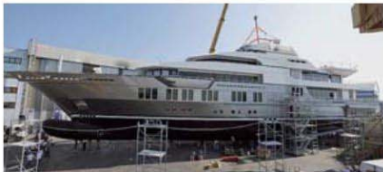
In Darsena Si chiama Stella Maris, il 72 metri di Yvs che ha dato lavoro all'indotto di Viareggio e non solo